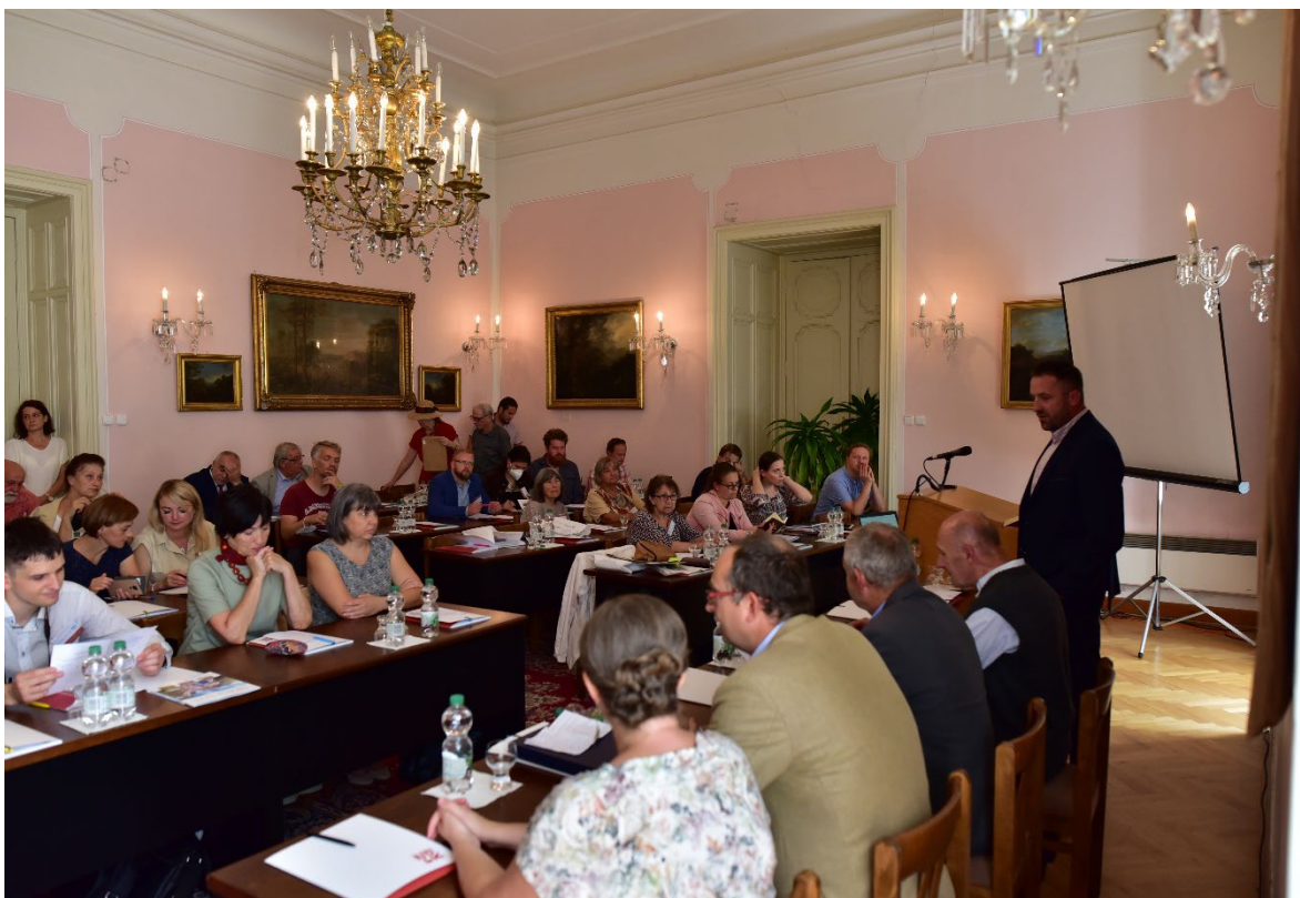
Slavnostní zahájení konference Muzea v přírodě a jejich role při záchraně lidové architektury, Strážnice, 15. 9. 2021.