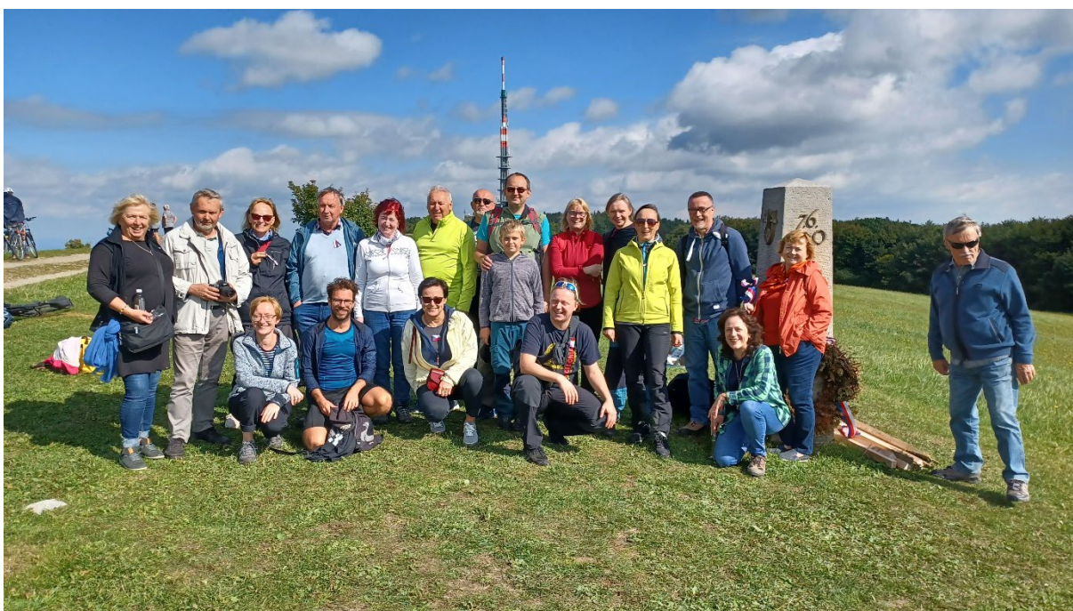
Setkání členů České národopisné společnosti a Národopisnej spoločnosti Slovenska, Velká Javořina, 25. 9. 2021.